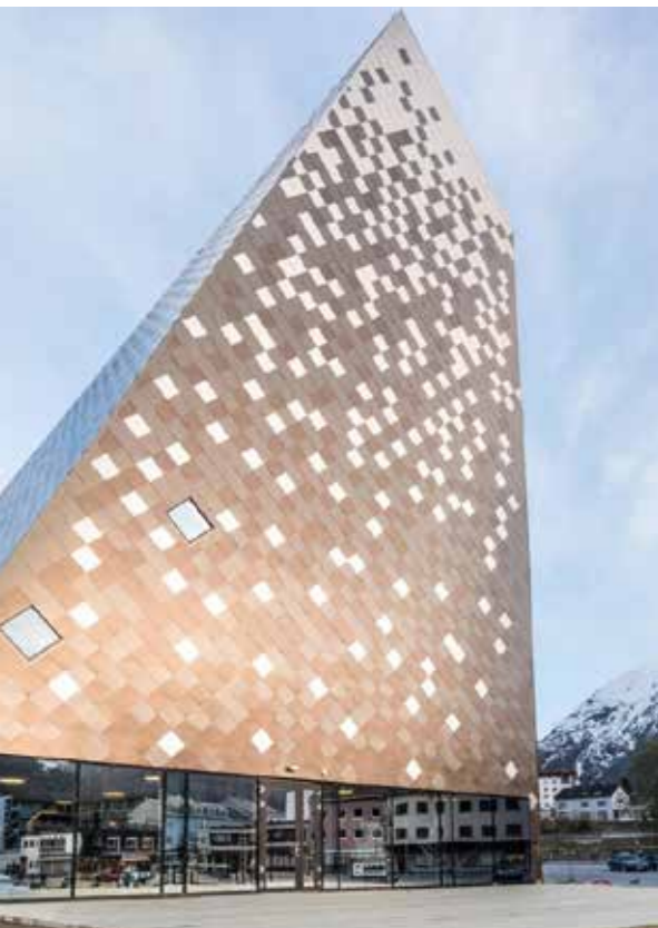
Tindesenteret. Reiulf Ramstad Arkitekter

Petal arbeider saman med deg for å verkeleggjere din visjon for bygget.