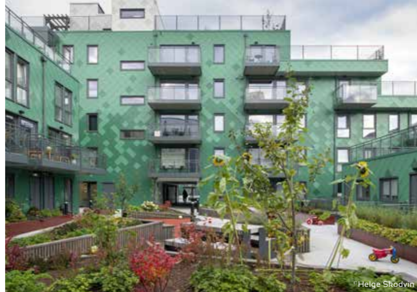
Damsgårdsundet. Montert av SBM as, arkitekt Tag Arkitekter